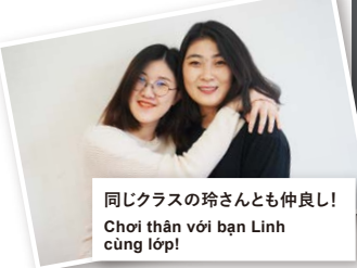
同じクラスの玲さんとも仲良し! Chơi thân với bạn Linh cùng lớp!

わたしの家族は日本と接する仕事をしています。だから昔からよく日本のことを教えられました。その影響もあって日本の文化や景色にとっても興味があり、日本に留学しようと思いました。留学先京都を選んだ最初のきっかけは好きな有名人の出身地が京都だったからです。進学説明会でこの学校を見つけて、学校の雰囲気がとても好きだったのでこの学校を選びました。先生たちはとても親切だし、同じ質問をしても何度でも答えてくれます。クラスのみんなども仲が良くて毎日楽しいです。 Gia đình mình làm công việc có tiếp xúc với Nhật Bản. Vì vậy mà từ xưa mình đã được dạy nhiều về Nhật Bản. Cũng vì ảnh hưởng đó mà mình rất quan tâm văn hóa và phong cảnh Nhật Bản. Mình muốn sang Nhật du học. Động cơ đầu tiên để mình lựa chọn Kyoto là nơi du học là vì Kyoto là nơi xuất thân của người nổi tiếng mà mình thích. Mình đã tìm ra trường này trong một buổi giới thiệu trường định hướng. Mình rất thích bầu không khí của trường nên mình đã chọn trường này. Thầy cô giáo rất tốt bụng, cùng một câu hỏi mà mình hỏi đi hỏi lại mấy lần nhưng lần nào thầy cô cũng trả lời cho mình. Các bạn trong lớp thì mình đều hòa thuận, vui vẻ mỗi ngày.